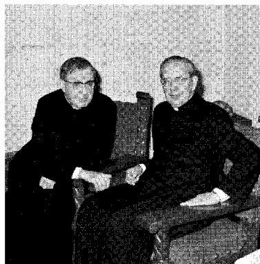
エスクリバー師（左）と ポルティーリヨ師（右）、1974年